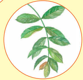
バナバ (コロソリン酸)